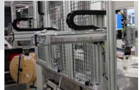
Pneumatický manipulátor s využitím bezpečnostních válců s vedením řady DGC-K.

kompletní řešení na klíč. Dodáme jim celé pracoviště, jehož součástí je nejen lis, ale i forma a střížné nástroje, to vše samozřejmě s vysokým podílem automatizace. Velmi dbáme na vysokou kvalitu našich výrobků a služeb včetně těch poprodejních. Budujeme si postupně svoje jméno s vědomím toho, že nejlepší referencí je právě naše odvedená práce a služby.