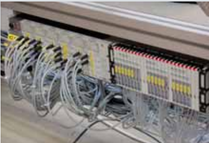
Nasazení výkonného pneumatického ostrova slučujícího jak elektrickou část (senzory apod.), tak i pneumatickou část s možností volby různých velikostí ventilů.