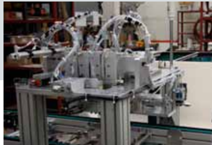
Přesná montáž dílců pomocí válců s vedením DFM.