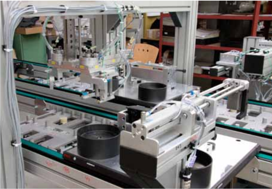
Kombinace přesné manipulace a otáčení s dílcem pomocí válců DGSL a rotačního válce DRRD.